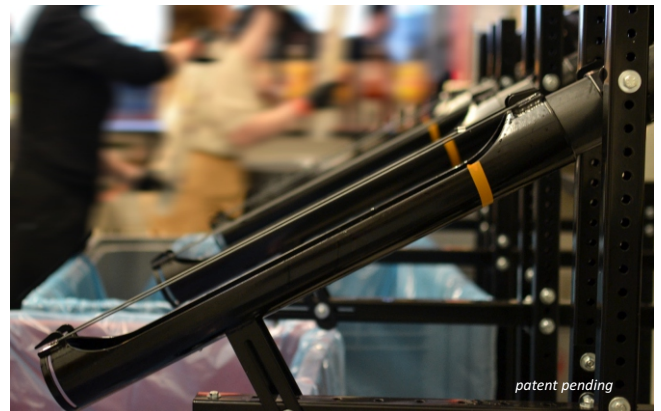
Les gobelets retournés sont soigneusement regroupés dans les tuyaux de collection spécialement conçus pour STAR.

STAR fait la preuve que des solutions techniques créatives peuvent résoudre des défis pratiques tout en garantissant la durabilité et l'efficacité.