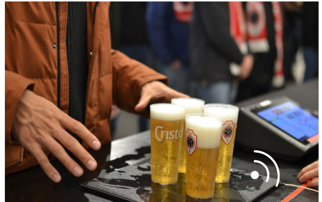
Les puces RFID des gobelets sont lues au Point of Vente.